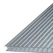
Lamina de policarbonato