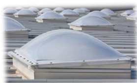
Domo de policarbonato